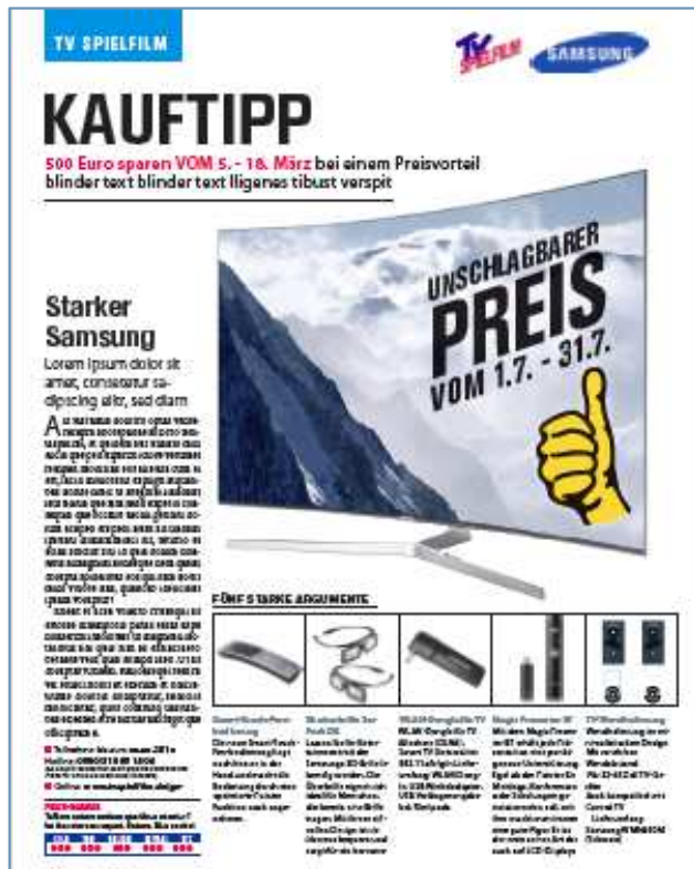
Unverbindliches Anmutungsbeispiel 1

TV SPIELFILM plus entwickelt ein neues Abverkaufskonzept für Werbekunden auf allen Plattformen.