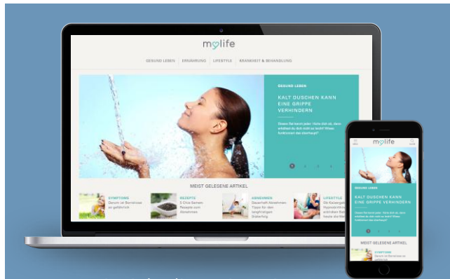
Beispiel Inline Microsite