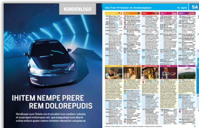
Unverbindliches Anmutungsbeispiel S. 4 Abschlussseite

Wir binden den Kunden in ein reichweitenstarkes und redaktionelles E-Mobilität-EXTRA ein – in Alleinstellung als 4- oder 6-seitiges Heft-im-Heft in TV SPIELFILM plus: