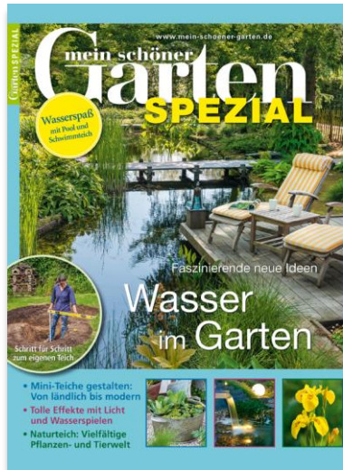
Titelcover & 4. Umschlagsseite