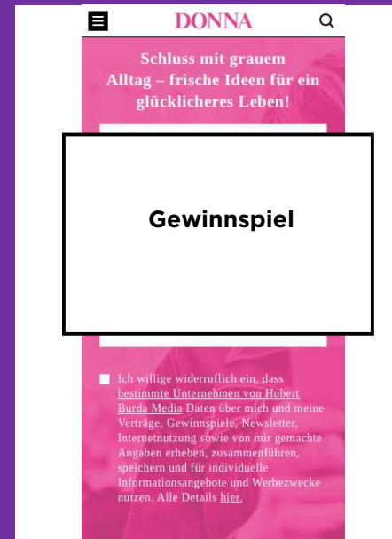
Beispiel Einbindung Gewinnspiel