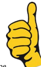
„Der goldene TV SPIELFILM Daumen“

Der goldenen Daumen steht für genau diese positive Haltung.