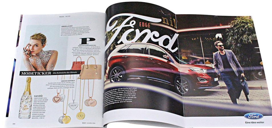
Beispiel Wrapping Gatefold in ELLE 11/2016