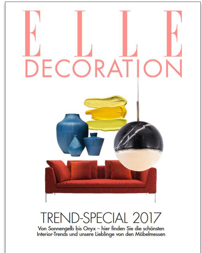
Cover Trend-Special 2017