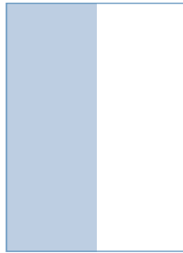
1/2 Seite hoch 102 x 297 mm (Breite x Höhe) € 11.564,-