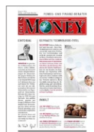
Fonds- und Finanz-Berater