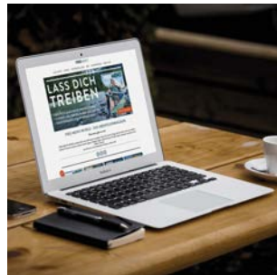
FREE MEN'S WORLD ONLINE