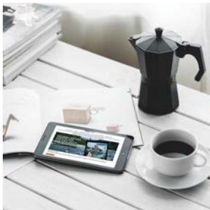
FREE MEN'S WORLD EPAPER